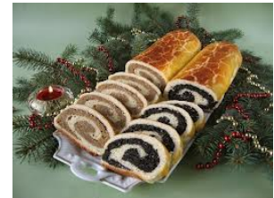
beigli (diós és mákos)